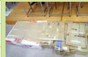
避難所体験の段ボールベッド