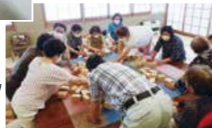
準備はみんなで行います。牌が大きいので、いい運動になります!!