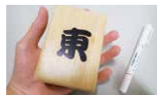
牌はたわし大の大きさと、重みがあります。

コミュニケーション麻雀は、2人~3人1組くらいのチームを4組作って行うレクリエーションです。使う牌は、通常のものよりも大きく、一個当たり240グラムほどの重さがあります。そのため、頭と身体を両方使った運動にもなります。ルールは通常の麻雀を簡略化して、分かりやすくしている一方で、麻雀本来の駆け引きや運などの要素はそのままのため、初心者の方と経験者が混じっても楽しむことができます。川崎町社会福祉協議会では、コミュニケーション麻雀やその他レクリエーショングッズの貸出を行っています。また、出前講座もありますので、興味のある方は気軽にお問合せ下さい。