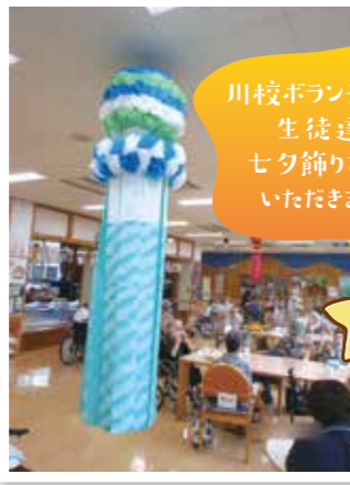
川校ボランティア部の 生徒達に、 七夕飾りも作って いただきました。