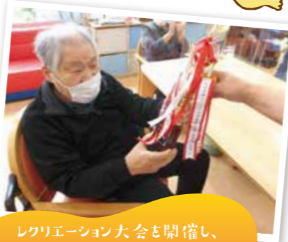
レクリエーション大会を開催し、 優勝者にトロフィーが授与されました。