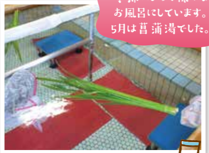
季節によって様々な お風呂にしています。 5月は菖蒲湯でした。