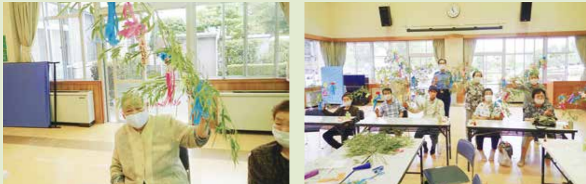
それぞれオリジナルの飾りつけをして、最後はみんなで記念写真!!