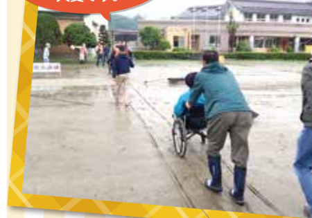
雨の中の車椅子での移動は、なかなか大変です。