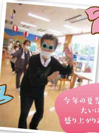
今年の夏祭りも、 大いに 盛り上がりました!!