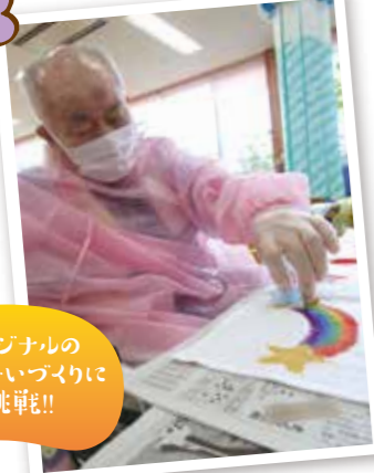
オリジナルの 手ぬいづりに 挑戦中!!