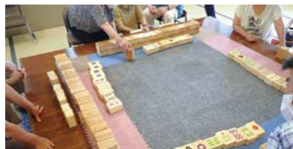
大事なのはコミュニケーション!!「どれにする?」「それとって」「はいどうぞ」などの協力の声自然と出てきます。