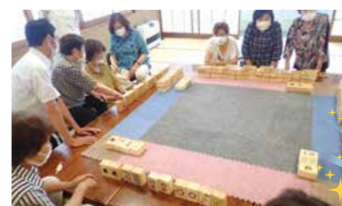
いきいきサロン(山村開発センター)

川崎町で地域のために活動している方や団体、地域活動などの「お宝」を募集しています!!自分たちやご近所での取り組み、こんな人があるなどをぜひ社会福祉協議会に教えてください。また、地域のためになにか活動をしたい、という方がいらっしゃれば、ぜひご連絡ください。