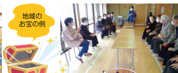
にこにこ会(中新町)